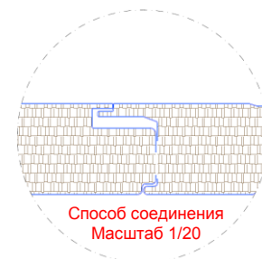
Способ соединения Масштаб 1/20

Минеральная вата, Толщина: 50-60-80-100-120 мм